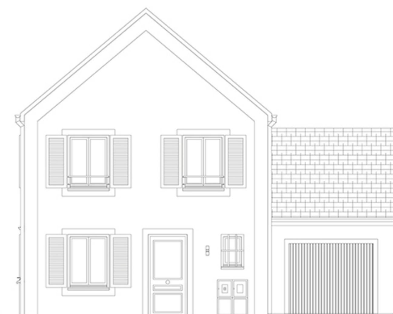
Façade côté rue